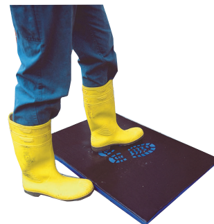
Desinfektionsmatte 60 x 90 cm