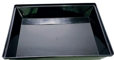
Desinfektionswanne Poly 60 x 50 x 10 cm