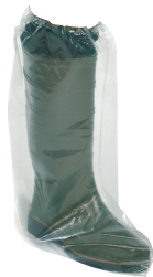
Überschuhe mit Gummizug

Größe: S - XL / 1 Packung: 100 Stk 20352-00-##