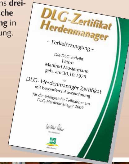
Nachweis Ihrer Qualifikation

Der DLG-Herdenmanager richtet sich an Betriebsleiter und leitende Angestellte von sauenhaltenden Betrieben. Vorausgesetzt wird eine mindestens drei-jährige praktische Berufserfahrung in der Sauenhaltung.